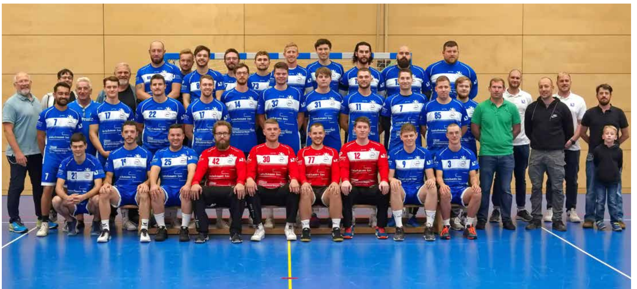
Fesche Burschen: Die Handball-Herrenmannschaften der SGA in den neuen Trikots

Die Mannschaften bedanken sich sehr herzlich bei allen Zuschauern, die sie bei den bisherigen Spielen so tatkräftig angefeuert haben. Sie freuen sich weiterhin auf volle Ränge, die Unterstützung bei den Spielen und auf eine schöne Zeit zusammen bei der SGA.