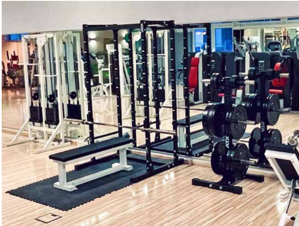
Beliebtes Trainingsgerät: Die neue Langhantel ist sehr beliebt und wird rege genutzt.

Neue Einrichtungen sowie neue Mitarbeitende im Gesundheitszentrum