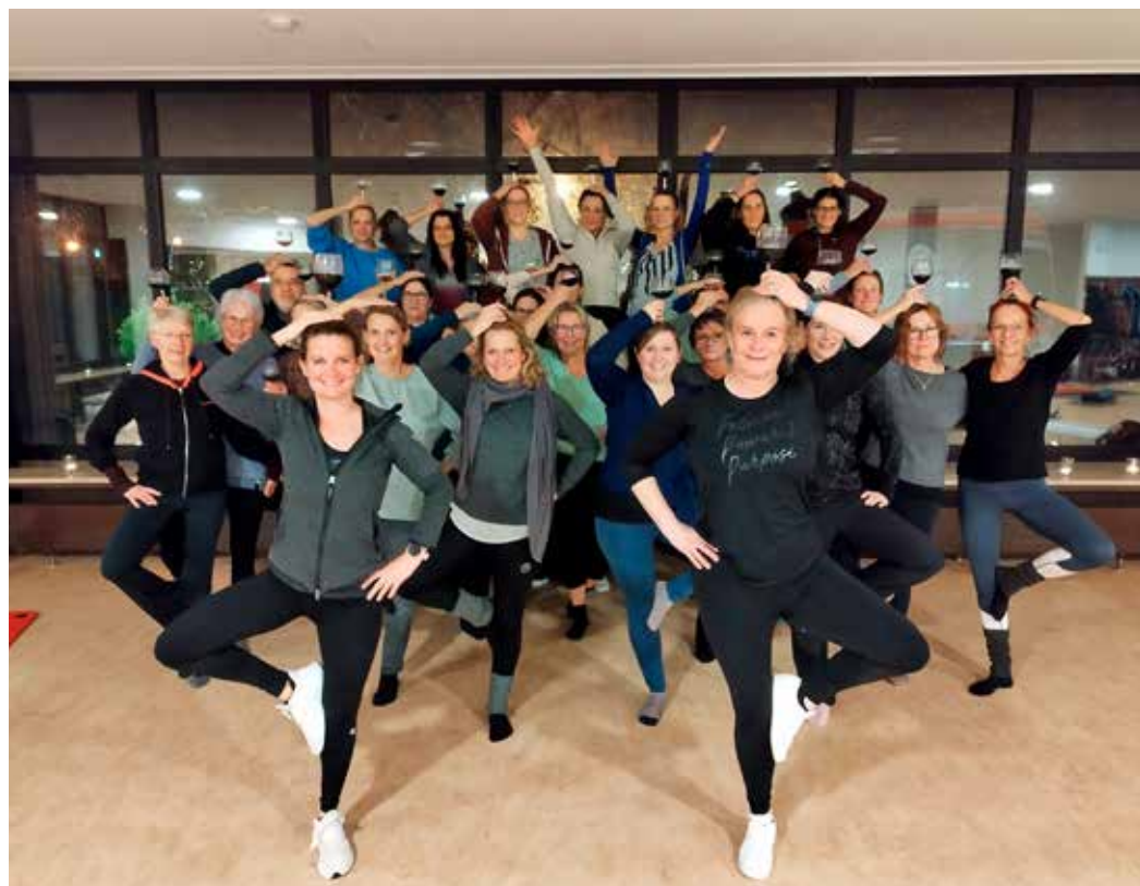
Alles im Gleichgewicht ...

Wer im November oder Dezember nicht dabei sein konnte, dem sei versichert: Die Übungsleiterinnen sind schon bei der Planung von weiteren YoPi-Events. Die gute Idee verdient eine Fortsetzung.