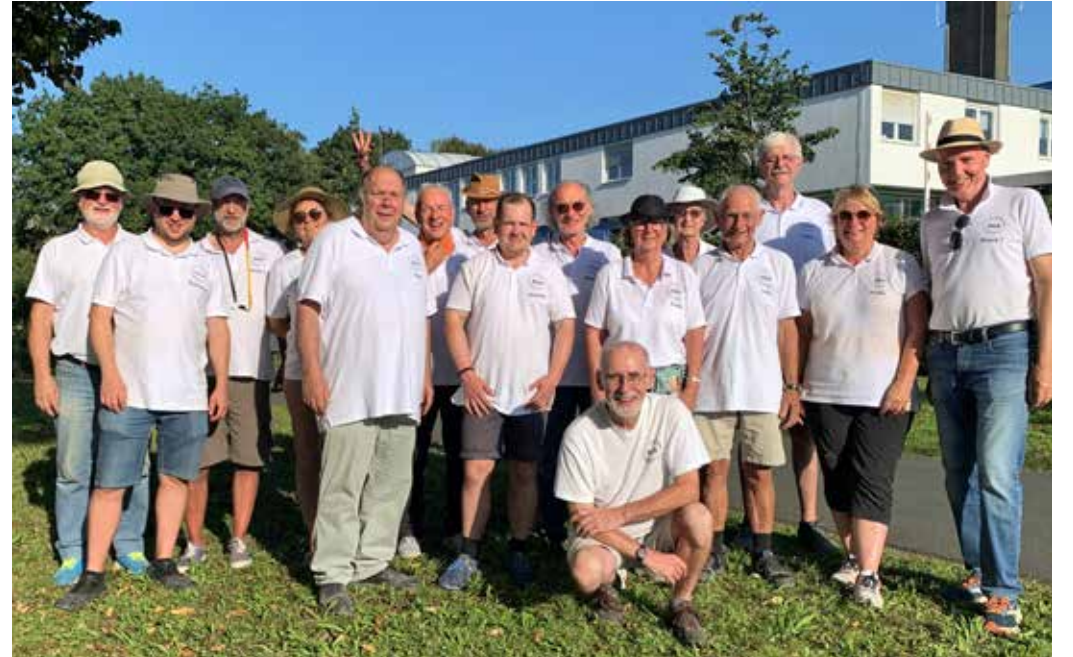
Die Spielerinnen und Spieler der SGA-Bouleabteilung (1. und 2. Mannschaft gemeinsam) am „heißen“ letzten Liga-Spieltag am 9. September 2023 in Gießen

Boule kann als Freizeit- und Leistungssport ausgeübt werden. Die SGA-Bouleabteilung bietet beides! Gespielt wird in der Wintersaison dienstags und donnerstags bereits ab 18.00 Uhr. Wer einfach mal reinschnuppern möchte, ist herzlich willkommen. Auch die Boulekugeln können vor Ort ausgeliehen werden.