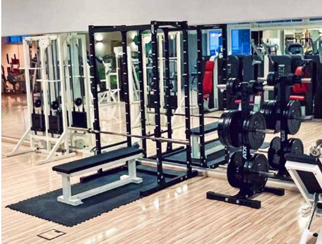
Beliebtes Trainingsgerät: Die neue Langhantel ist sehr beliebt und wird rege genutzt.

Neue Einrichtungen sowie neue Mitarbeitende im Gesundheitszentrum